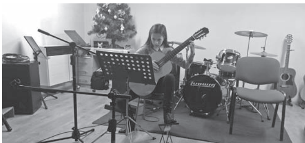
Timea sa prezentovala hrou na gitare

Tento rok sa vianočný koncert v našej obci nekonal. Ale naše deti sa predstavili v Šaštíne – Strážoch 14.12.2016.