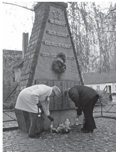
Úcta našim rodákom