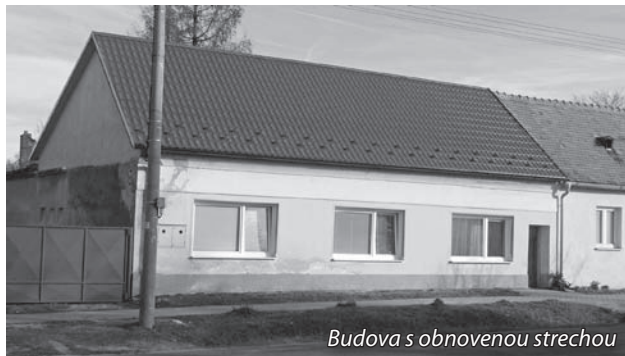
Budova s obnovenou strechou