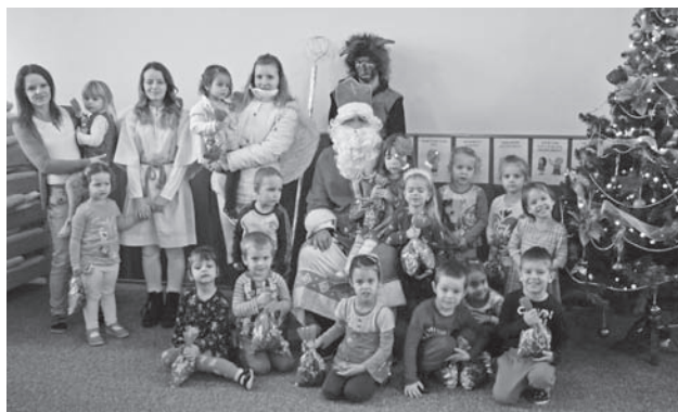
Zazvonil zvonček a kto prišiel?

Trochu nás vystrašil čertisko rohatý, no našťastie prišiel aj dobrý anjelik, ktorý ho zahnal. Keď deti zbadali, že Mikuláš neprišiel naprázdno, rozžiarili sa im očka. Deti privítali Mikuláša pesničkami a básničkami. Nakoniec deti Mikulášovi sľúbili, že budú celý rok dobré, budú poslúchať pani učiteľky i rodičov. Mikuláš rozdal deťom balíčky a už sa ponáhlal na návštevu do triedy lienok k našim najmenším. Veď aj v tejto triede sa na Mikulášov príchod tešili a pripravili si pekný program. Niekomu síce vypadla slzička, ale inak boli deti veľmi statočné. Za odmenu dostali sladké balíčky a s dobrým dedkom Mikulášom sa rozlúčili.