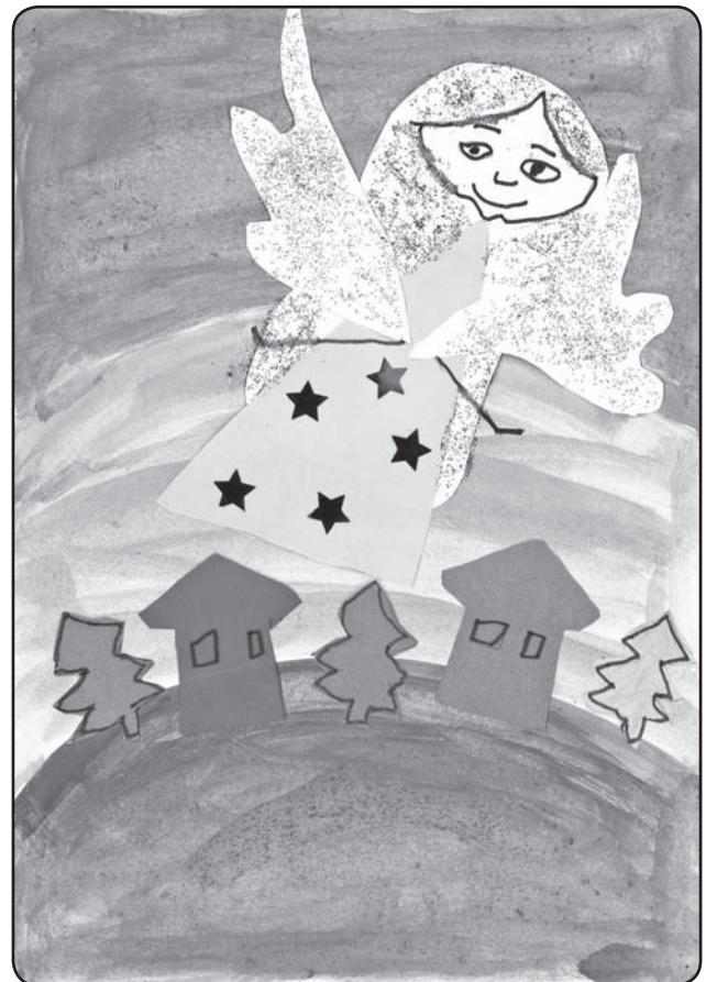
Zaire Malíková, 2. ročník