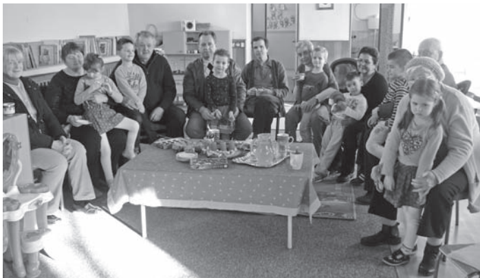
Neopísateľná je radosť detí, keď môžu privítať svoju babku či dedka v materskej škole.