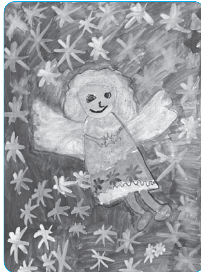
Emília Snížeková, 1. ročník