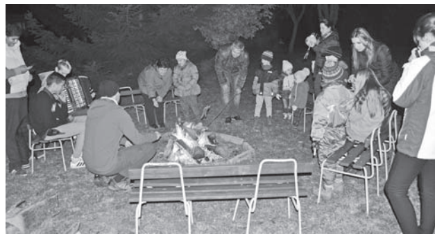
Na záverečnej opekačke

Dobre im padol teplý čaj, opekali si špekáčiky, hrali rôzne hry. Nakoniec sa všetci natešení, že sa akcia vydarila, pobrali domov.