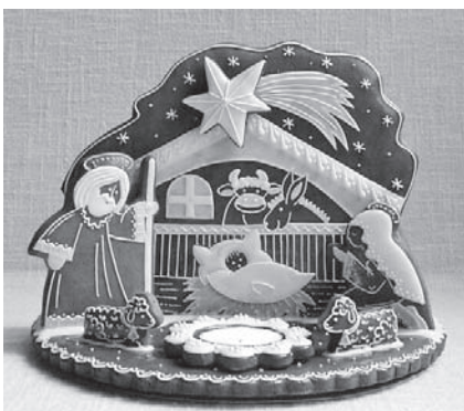
Včelie produkty ako hlavná surovina vianočných medovníkov

Úžitok z včiel je mnohostranný – hlavný úžitok je v opelení rastlín, produkcii medu, včelieho vosku, propolisu a aj včelí jed má priaznivé účinky na niektoré zdravotné problémy, pokiaľ nie je človek vyložene alergický na včelí jed. Podľa jedného starého včelára, ktorý už žiaľ nie je medzi nami, včely musia pichať, lebo vraj keby nepichali, choval by ich každý blbec. Kto má záujem o chov včiel musí sa veľa naučiť a musí byť pripravený, že práca okolo včiel je náročná, ku včelám treba ísť vždy keď to ony potrebujú a nie len vtedy kedy má včelár čas. Každého záujemcu naša organizácia rada privíta vo svojich radoch a v začiatkoch každému ochotne pomôže všetci členovia.