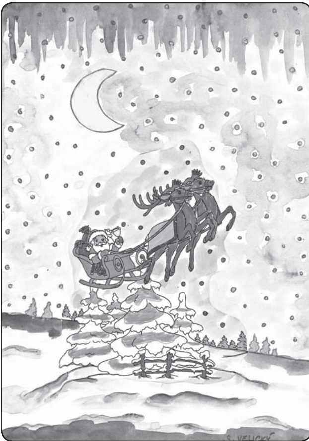
Samuel Velický, 2. ročník