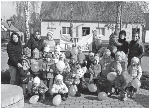
Deti z MŠ oznamujú všetkým aký je dnes deň

Významným medzníkom v dejinách predškolskej pedagogiky na Slovensku sa stal dátum 4. november 1829. V tento deň vznikla a bola založená v Banskej Bystrici prvá detská opatrovňa na území Slovenska. Jej zakladateľkou bola grófka Mária Terézia Brunswická. Česť a vďaka patrí tejto grófke za to, že vystihla špecifikum didaktiky materskej školy už v jej počiatkoch: „Tieto malé deti tak vyučujú, že ani nevedia, že sa učili, a celý čas trávia tak, že si myslia, že sa len hrali.“ A práve tento deň sa stal významným dňom, nie len pre materské školy, ale aj pre náš štát.