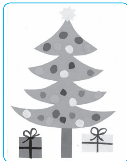
Natália Drinková, 3. ročník