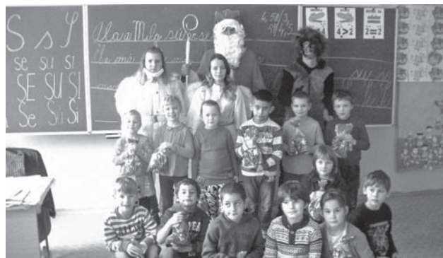
Mikuláš v škole

A Mikuláš sa dostavil aj do našej školy dňa 6. decembra, ako sa patrí. Tiež ho žiaci prekvapili svojimi vystúpeniami a niektorí museli z nich robiť aj reparát, ale nakoniec sa všetci tešili z jeho darčekom.