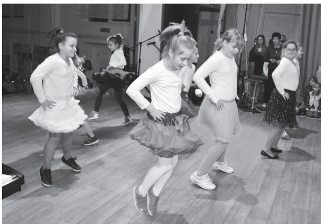
Predstavenie našich malých tanečníkov

Už dlhšiu dobu prejavovali mamičky detí základnej školy záujem o tanečný krúžok. V tomto roku im ZUŠ vyhovel a tanečný krúžok bol ihneď naplnený. V piatok 16.12. tancovali na galakonzerte.