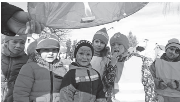
Balónik šťastia štartuje...

Dňa 4. novembra 2016 sa naša materská škola prvý krát zapojila do osláv sviatku všetkých materských škôl na Slovensku. Prostredníctvom nástenky v šatniach sme oznámili rodičom, že 4. november je významným dňom všetkých materských škôl, ktorý si zaslúži poriadnu oslavu. V triedach sme sa zabávali, spievali a tancovali. A samozrejme nechýbalo občerstvenie, balóniky a dobrá nálada. V oslave sme pokračovali slávnostným pochodom v obci. Deti s hrdosťou niesli transparent, ktorý informoval okoloidúcich o našom sviatku a dôležitosti materskej školy. Na námestí sme vypustili balón šťastia s práním, aby naše deti prežili ešte veľa krásnych a radostných chvíľ v materskej škole.