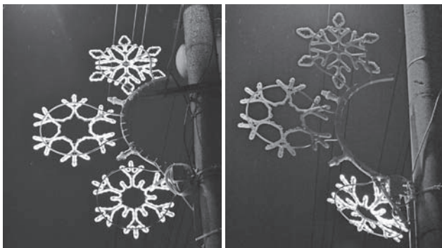
Naša vianočná výzdoba

Aby bola radosť zo stromčeka ešte väčšia rozhodli sme sa pre novú vianočnú výzdobu na stĺpy, zatiaľ len pre šesť. V piatok 16.12.2016 bola výzdoba namontovaná na stĺpy, ten kto mal šťastie mohol ju v plnej paráde vidieť len v piatok, pretože už v sobotu večer bola jedna z týchto ozdôb zlikvidovaná.