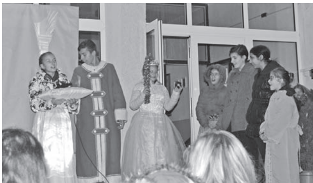
Čakalo nás však prevrpenie.

Naša škola opäť organizovala lampiónový sprievod, ktorým sme sa rozlúčili s tohtoročnou jeseňou. Stalo sa tak dňa 4.11.2016 o 17-tej hodine, kedy sa pred školou začali schádzať deti z materskej školy, žiaci z našej školy, aj niektorí rodičia a tiež pani učiteľky.