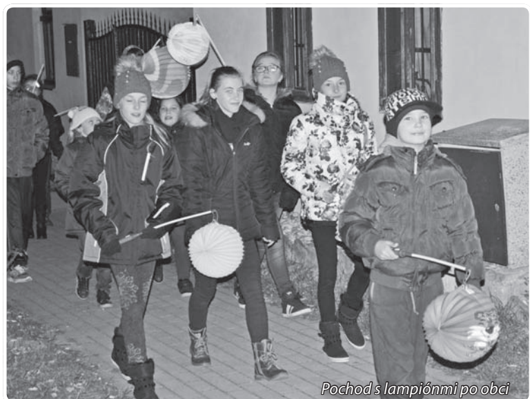
Pochod s lampiónmi po obci

Po tradičnom pochode s lampiónmi a za sprievodu veselej hudby z miestneho rozhlasu sa všetci opäť vrátili ku škole.