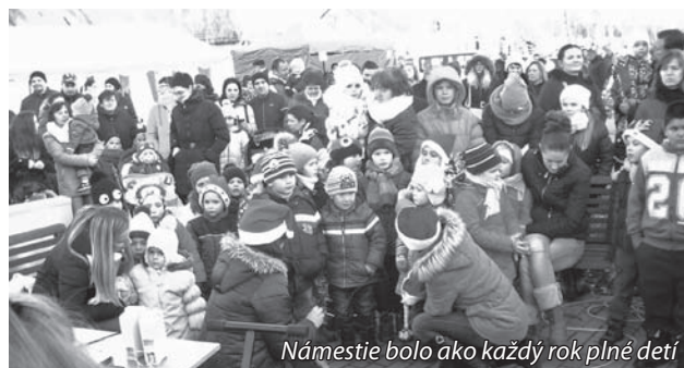
Námestie bolo ako každý rok plné detí

Aby konečne prišiel, museli na neho spoločne zavolať: „Mikuláš, Mikuláš, príď medzi nás!“ Mikuláš prišiel v sprievode