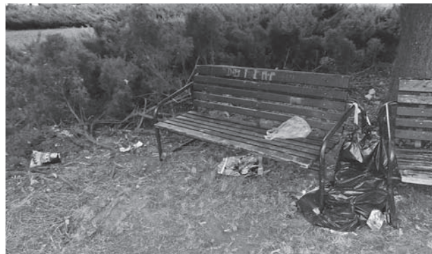
Častý pohľad na lavičky

A pri tejto príležitosti mi nedá nespomenúť aj nové detské ihrisko pri hlavnej ceste, ktoré bolo vybudované hlavne pre malé deti, ktoré ho bohužiaľ ani zďaleka nevyužívajú tak ako tie „veľké“ ale len vzrastom, určite nie rozumom, pretože v tom prípade ak by boli veľké aj rozumom, nebolo by tam vždy toľko odpadu, plastových fliaš, papierov. Aj napriek tomu, že tam ešte nie je umiestnený odpadový kôš, je tam vždy plastové vrece, do ktorého sa dá konkrétny odpad vhodiť, poprípade sú odpadové koše umiestnené aj na námestí. Ale to je pre nich asi už ďaleko.