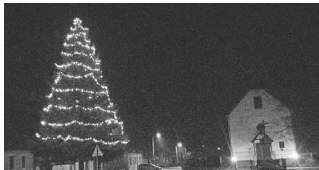
Máme krásne vyzdobený vianočný stromček

Aj touto cestou patrí poďakovanie všetkým rodinám, ktoré našu školu podporili.