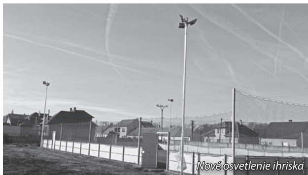
Nové osvetlenie ihriska