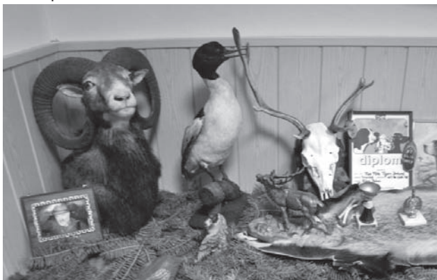
Naša expozícia na výstave usporiadanej záhradkármi

Pri príležitosti Medzinárodného dňa detí členovia Poľovníckeho