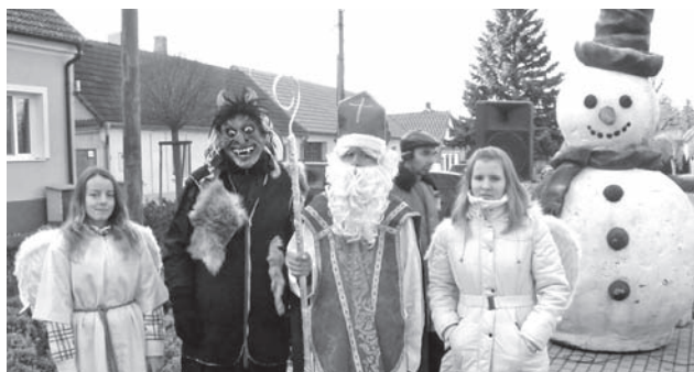
Mikuláš prišiel medzi nás

Zubaté slniečko, studený vzduch a plné námestie ľudí! No predsa prišiel Mikuláš medzi nás! Stalo sa tak 3. decembra, najmä deti netrpezlivo čakali na Mikuláša.