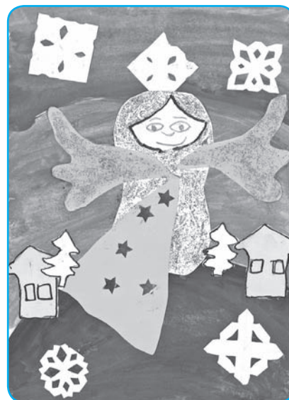
Krištof Višvader, 2.ročník