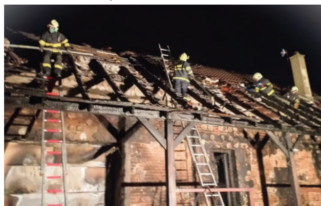
Zásah pri požiare rodinného domu

Piaty, čerstvo v pamäti mnohých, bol požiar rodinného domu rod. Lieskovských 4.decembra.