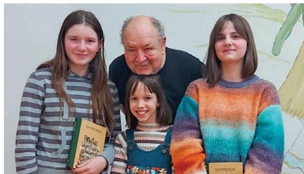
Spoločná fotografia s piatačkami

Predvianočné obdobie nám prišiel spríjemniť známy slovenský básnik, spisovateľ a textár Daniel Hevier. Pútať formou nám vyrozprával svoje zážitky zo školských čias, ale i zo svojho spisovateľského života. Počas besedy vtipným spôsobom odpovedal na zvedavé otázky našich žiakov. Deti zaujímali otázky typu: Ktorá autorova kniha je jeho najobľúbenejšia? Ktoré ročné obdobie má rád? Ktorému futbalistovi a futbalovému klubu fandi? Aké známky mal v škole? Kedy začal písať pre deti? Aký je jeho obľúbený hudobný žáner? Či už napísal horor? A mnohé iné otázky týkajúce sa jeho života a umeleckej tvorby.