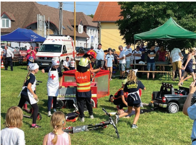
Ukážka tréningu zásehovej činnosti mladých hasičov

19. augusta sme sa s deťmi zúčastnili prvej časti osláv 100. výročia založenia Okresnej hasičskej jednoty č.10 v Jablonici. Pre divákov bola pripravená pestrá výstava techniky z celého okresu a ukážky dobových odevov, ukážky hasenia s historickými