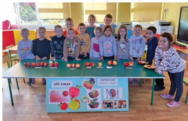
úťaž o najlepšie jablko