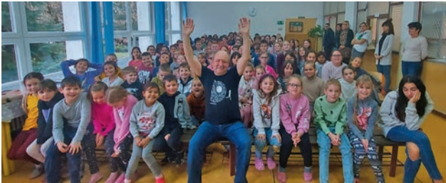
Daniel Hevier u nás v škole

Sme radi, že našu školu navštívila takáto významná slovenská literárna osobnosť.