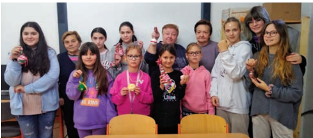
Háčkovanie s dôchodcami