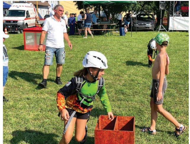
Ukážka zásehovej činnosti mladých hasičov v Jablonici

kou technikou a naša DHZ si pre túto príležitosť pripravila 2 scény s deťmi. Ukážku hasenia a ukážku súťaže detský železný hasič. Nemusím sa asi opakovať, že mali veľký ohlas. Sú to naše šikovné slniečka.