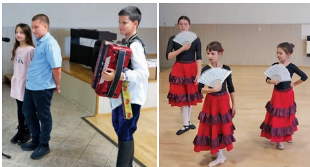
Na veselú nôtu

I tento rok sme boli potešiť dôchodcov našej obce na ich posedení pripravenom k Mesiacu úcty k starším. Slávnostné chvíle sme im spríjemnili programom, ktorý pozostával z piesní, básní a tanca v podaní našich šikovných žiakov.