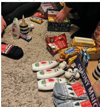
Čo dať do krabičiek?

„Koľko lásky sa zmestí do krabice od topánok?“ alebo „Zabalíme do krabičky kus svojho srdca akoby krabička mala ísť niekomu, koho naozaj milujeme.“ Výzva je určená pre nás všetkých, ktorí chceme potešiť na Vianoce osamelých seniorov. A tak môžeme zabalit' do krabičky niečo sladké, niečo slané, niečo teplé, niečo mäkké, niečo voňavé, niečo na zábavu a niečo zo srdca. Často je to jediný darček, ktorý dostanú, preto do krabice vkladáme aj kúsok svojho srdca úprimným pozdravom.