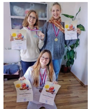
Dievčatám srdečne blahoželáme!