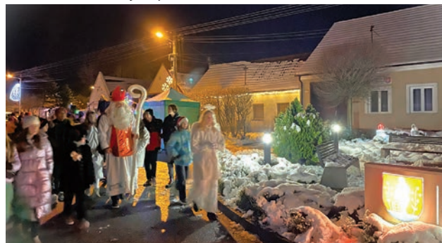
Mikuláš s deťmi idú rozsvietiť strom

Mikuláš pri svojom odchode nezabudol rozsvietiť obecný vianočný stromček. V detských očiach bolo vidieť radosť z obdarovania a už teraz sa tešia na Mikuláša, anjelikov i čertov, ktorí k nám zavítajú opäť o rok.