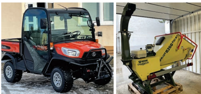
Nové komunálne vozidlo Nová drvička komunálneho odpadu