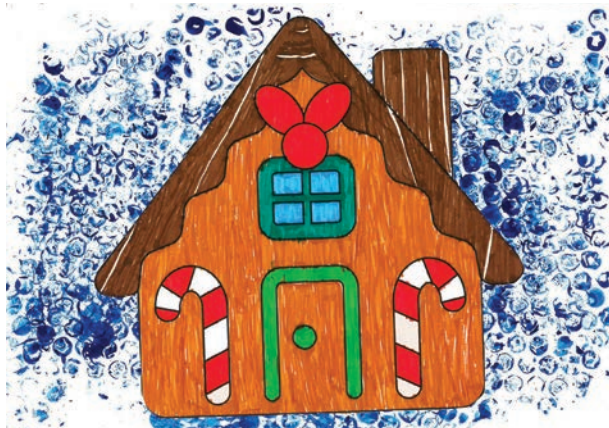
Natália Bajteková, 2. trieda