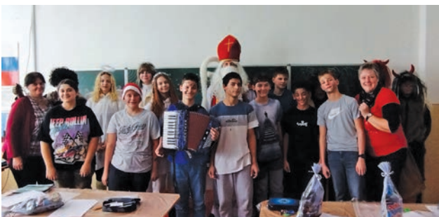
Mikuláš v 7. triede

Text a foto: Mgr. Katarína Michalicová, Mgr. Eva Gachová