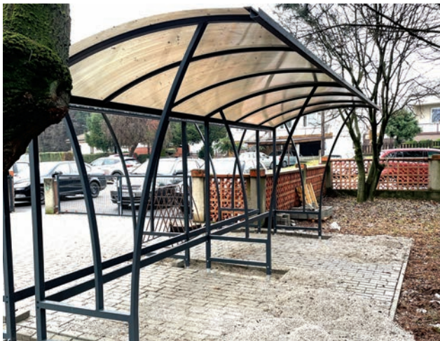
Nové stojisko bicyklov

Úpravu vstupu do základnej školy sme dokončili v tomto roku. Zabezpečili sme novú vstupnú bránu a nové prístrešky na bicykle. Veľa detí chodí do školy na bicykli, takmer polovica, takže vznikla potreba rozšíriť priestor na parkovanie a zabezpečiť ho prístreškami. Stojany sú tam zatiaľ ešte staré a ich počet nepostačuje, no na jar zabezpečíme nové.