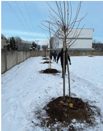
Výsadba stromov na štadióne

V pondelok prišli aj s technikou, všetko sme vymerali a doobeda bolo vyhlbených 59 jám. Silnejšie mrazy netrvali dlho, takže bola premrznutá len minimálna vrstva pôdy na povrchu a naozaj to išlo „ako po masle“. Poobede prišla ďalšia partia a začali sadiť stromy. Na druhý deň bola výsadba ukončená.