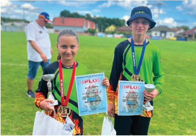
Úspechy mladých hasičov

Mimo zásehovej činnosti sa venujeme hlavne deťom na Hasičskom krúžku, kde sa stretávame pravidelne každý týždeň a s deťmi sme sa aj zúčastnili viacerých súťaží. V prvom polroku sme boli na troch súťažiach, umiestnili sme sa aj na pekých medailových miestach.