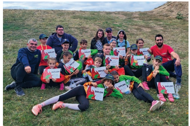
Trofeje zo súťaže v Moravskej Novej Vsi

Hneď ďalší víkend 16. septembra sme zabojovali, my dospelí, na retro súťaži v Senici a v nedeľu 17. septembra deti na detskej súťaži v Sobotišti. A september sme ukončili na Jesennej časti hry Plameň v Hradišti pod Vrátnom 24. septembra, kde sme sa umiestnili na krásnom treťom a štvrtom mieste.