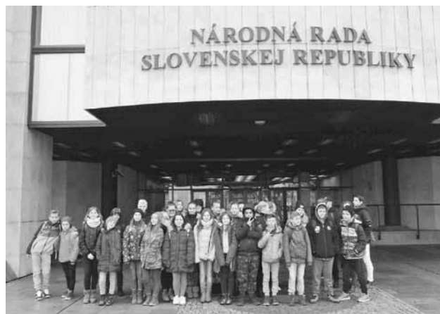
Pred budovou NR SR

Po príjemne a rýchlo ubiehajúcej ceste autobusom sme konečne dorazili na miesto. Keď sme vošli dnu do Národnej rady Slovenskej republiky, všetci sme ostali ako obarení. Pozerali sme vpravo i vľavo, dúfajúc, že uvidíme nejakého poslanca.