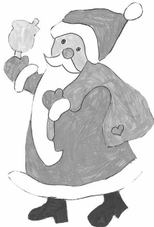
Adelka Včelková, 1. trieda