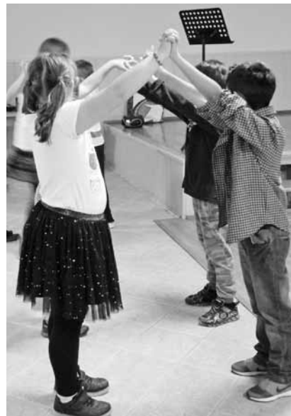
Ľudové piesne aj tančeky sa páčili