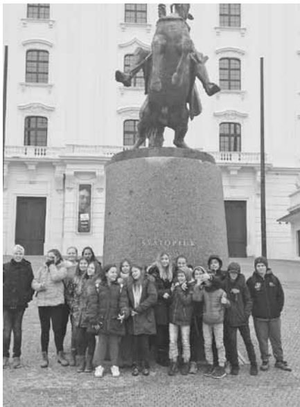
Na nádvorí Bratislavského hradu

Po dvoch hodinách sme sa stretli a išli do autobusu. Cesta domov bola veľmi zaujímavá, pretože všetci si navzájom prezerali, čo si nakúpili. A tak so šťastnými tvármi a veľkými úsmevmi sme išli domov.