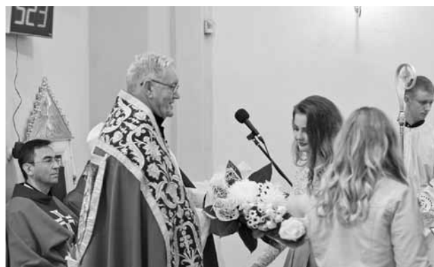
Podakovanie p. dekanovi

stáva dokonalejším spôsobom členom Cirkvi, je užšie spojený s Cirkvou. Nielen s miestnou, ale vďaka biskupovi spája birmovaného so Všeobecnou Cirkvou. Je prirodzenou vecou, že prijatie kandidáta do tohto spoločenstva sa koná skrze biskupa, ktorý stojí na jeho čele.