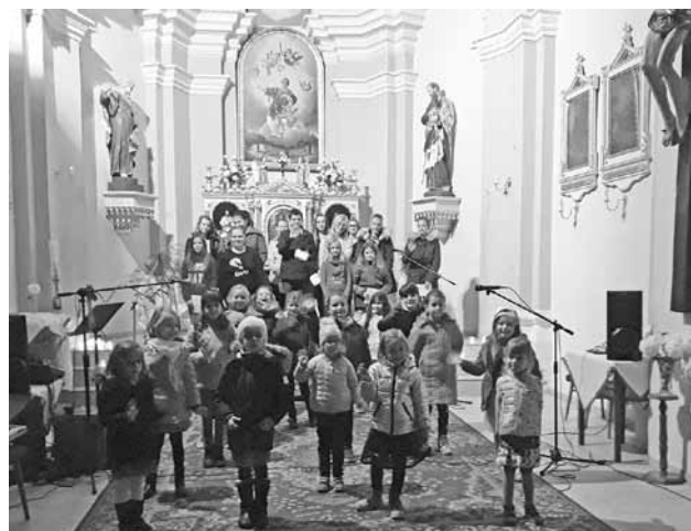
Oslava v kostole