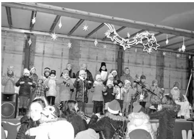
Slniečka spievajú Mikulášovi

Počas desiatich rokov sa v zbere vystriedalo približne okolo 70 detí. Niektorí v našom zbere vyrastali, od prvého stupňa základnej školy až po nástup na strednú školu. Okrem spievania sme s nimi prežívali ich "pubertálne" stavy :), radosti aj starosti. Pretože aj o tom sme my. Snažíme sa medzi sebou vytvárať putá, z ktorých chceme aby deti cítili, že nemusia robiť nič nasilu a nebrali skúšky ako povinnosť. Naše skúšky sa konajú každý piatok v kostole. Je to hodina plná zábavy, sem - tam detskej roztopašnosti a radosti, ktorú svojimi vystúpeniami prenášajú na obecenstvo. Od minulého roku nastúpilo do zboru aj niekoľko detí z materskej školy. Napriek tomu, že počtom obyvateľov nepatríme k veľkým obciam, máme veľa talentovaných, šikovných a dobrých detí. Patrí im veľká vďaka. Namiesto toho, aby v piatok odložili školské tašky a začali víkendovať, chodia poctivo na skúšky a s nadšením sa učia nové piesne, ktorými chcú tešiť ostatných. Momentálne má zbor 20 členov od troch po trinásť rokov a sme šťastní, že je záujem zo strany detí aj rodičov stať sa našou súčasťou.