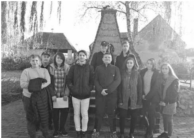
Žiaci 9. ročníka

Nasledovala už len minúta ticha venovaná všetkým padlým hrdinom, po ktorej sa účastníci oslavy, zväčša starší ľudia a naši deviataci rozišli.