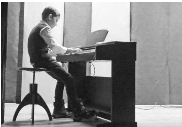
Prezentácia práce ZUŠ