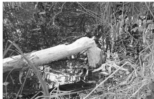
NPR Červený rybník navštívil bobor