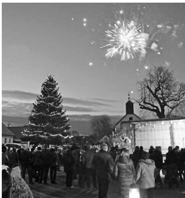
Čary-máry zvonček, nech rozsvieti sa vianočný stromček...

deti. Sem-tam aj také našli a niesli ich do pekla.