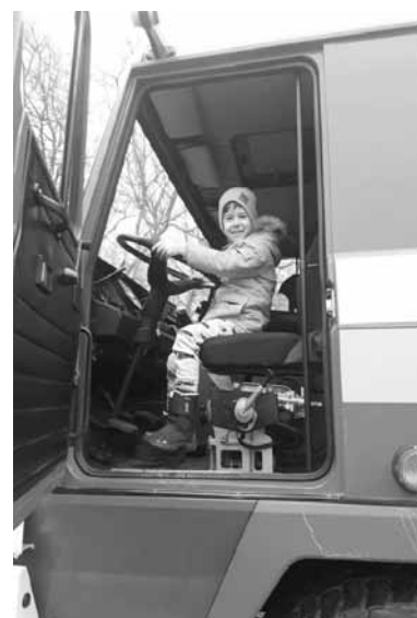
Záujem detí o techniku