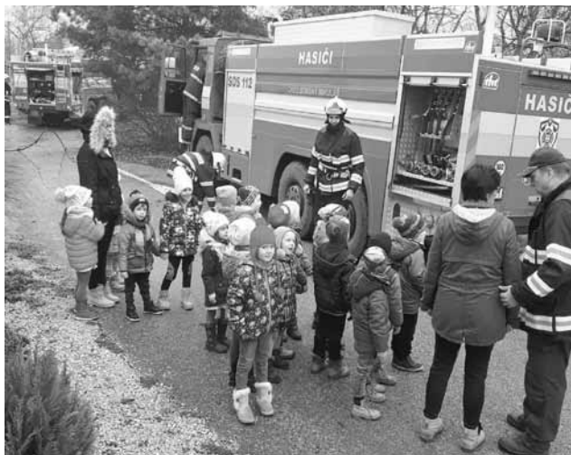
Deti po evakuácii

Nebojte sa, vďaka Bohu sa jednalo len o taktické cvičenie jednotiek DHZO okrsku Borský Mikuláš, ktorého cieľom bolo prehĺbiť schopnosti a zručnosti veliteľov jednotiek DHZO pri zásahu alebo pri riadení síl a nasadzovaní hasičskej techniky a vecných prostriedkov a pri likvidácii požiaru v materskej škole so zameraním na evakuáciu väčšieho počtu osôb a precvičovať pripravenosť a akcieschopnosť jednotiek DHZO, ako aj súčinnosť s inými DHZO okrsku Borský Mikuláš, záchrannými zložkami integrovaného záchranného systému a ostatnými špeciálnymi službami pri zásahu.