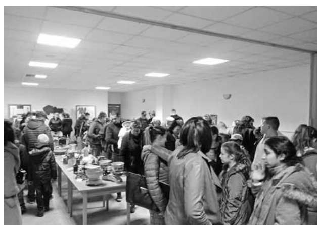
Bohatá účasť na výstave

Po sprievode sme sa ocitli na školskom dvore, kde niektorí opekali špekáčky pri ohníku a rodičia zasa pili čerstvý teplučký čaj a varené víno. Bol to super zážitok. Zúčastnení sa zabávali do neskorých hodín.