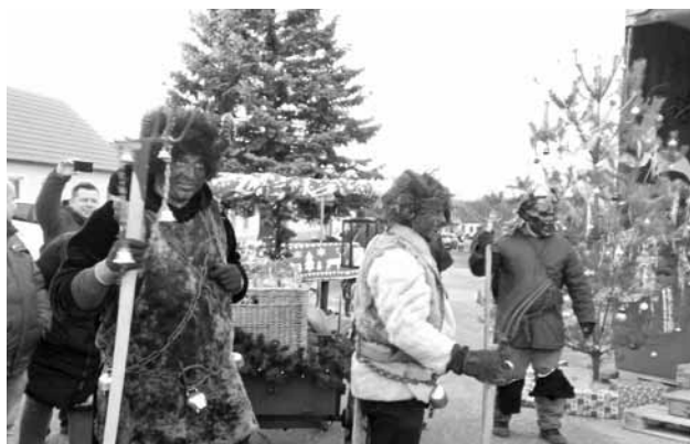
Čerti hľadajú neposlušné deti