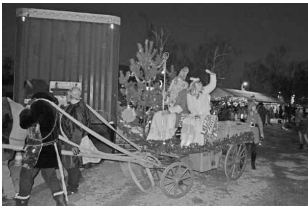
Dovidenia o rok

Vďaka patrí všetkým, ktorí sa na peknej akcii podieľali: rodičom, OÚ, žiakom, učiteľom a najmä sponzorom.