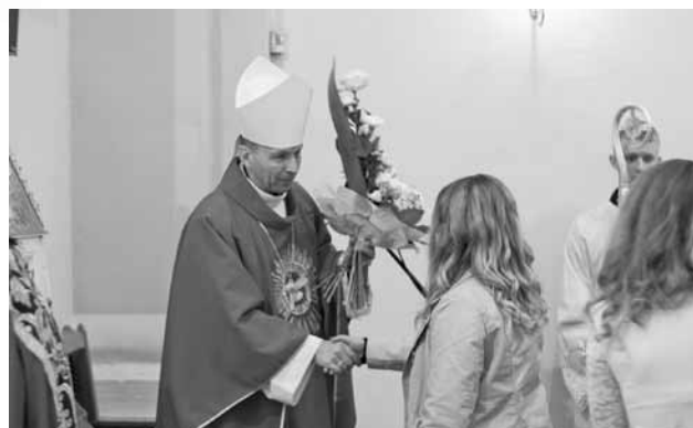
Podakovanie otcovi biskupovi