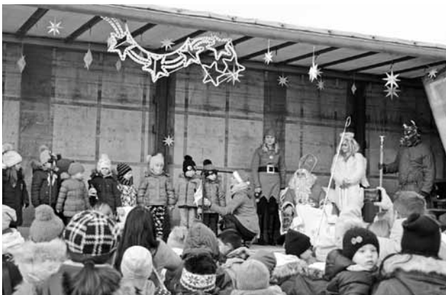
Deti vítajú Mikuláša na námestí básničkami

Konečne nastal ten deň, kedy aj nás v škôlke navštívil túžobne očakávaný Mikuláš. Nebol však sám. Spolu s Mikulášom prišli aj jeho dvaja pomocníci anjeli a čertík. Čertíka sa niektoré detičky aj báli, ale naozaj len trošička. Veď neprišiel