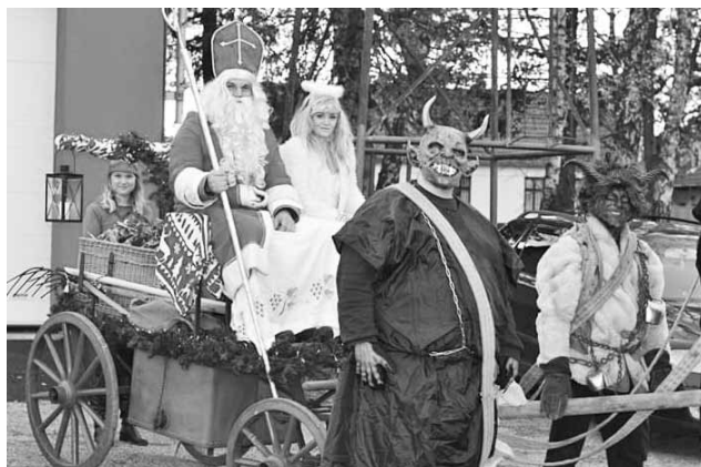
Mikuláš cestuje medzi deti

Tak sme ich rýchlo naložili na naše zásahové vozidlo a upalovali vpred, lebo podľa informácií sa to na našom námestí už plnilo nedočkavými detičkami plnými očakávaní, kedy Mikuláš dorazí, aby mu mohli predniesť svoje pesničky a básničky, ktoré si pre neho nachystali.