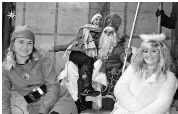
Mikuláš prišiel aj s pomocníkmi

Mikuláš sa nechal dlho prehovárať, deti ho museli vyvolať, aby predsa len prišiel. Hneď po príchode sa začal program, Mikuláš ho aj s anjelom pozorne sledovali a deti, ktoré pekne spievali, recitovali, dostali balíčky plné rôznych sladkostí. Čerti sa nezapreli, prechádzali sa po námestí a hľadali neposlušné