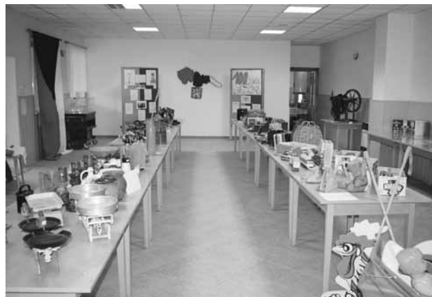
Pohľad na exponáty výstavy

Po zaujímavej výstave sme sa presunuli na ulicu, kde začal sprievod. Deti s lampiónmi boli šťastné a rady sa prešli okolo Lakšárskej Novej Vsi.